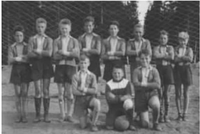
Nostalgisk bilde. Småguttelaget 56-57