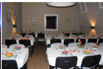
Klubbhuset og stadionbygget pyntet